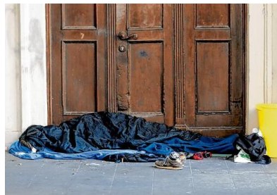
Obdachlose haben nur wenige Orte, an denen sie sich aufhalten können. Ein besonderer Stadtrundgang machte jetzt auf dieses Thema aufmerksam.